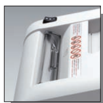
Volet de sécurité