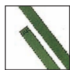
Coupe fibres 4 mm Niveau de sécurité DIN 2 Documents internes.